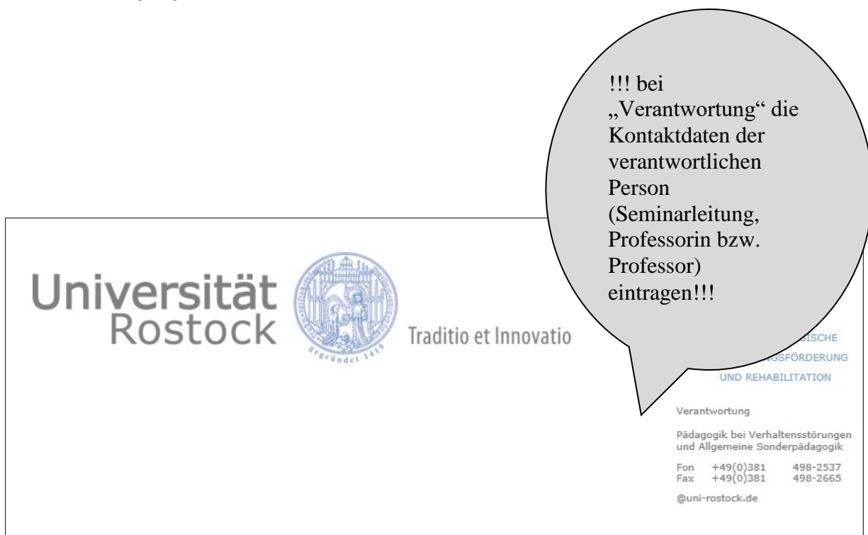
Abbildung 2: Muster Briefkopf der Universität Rostock